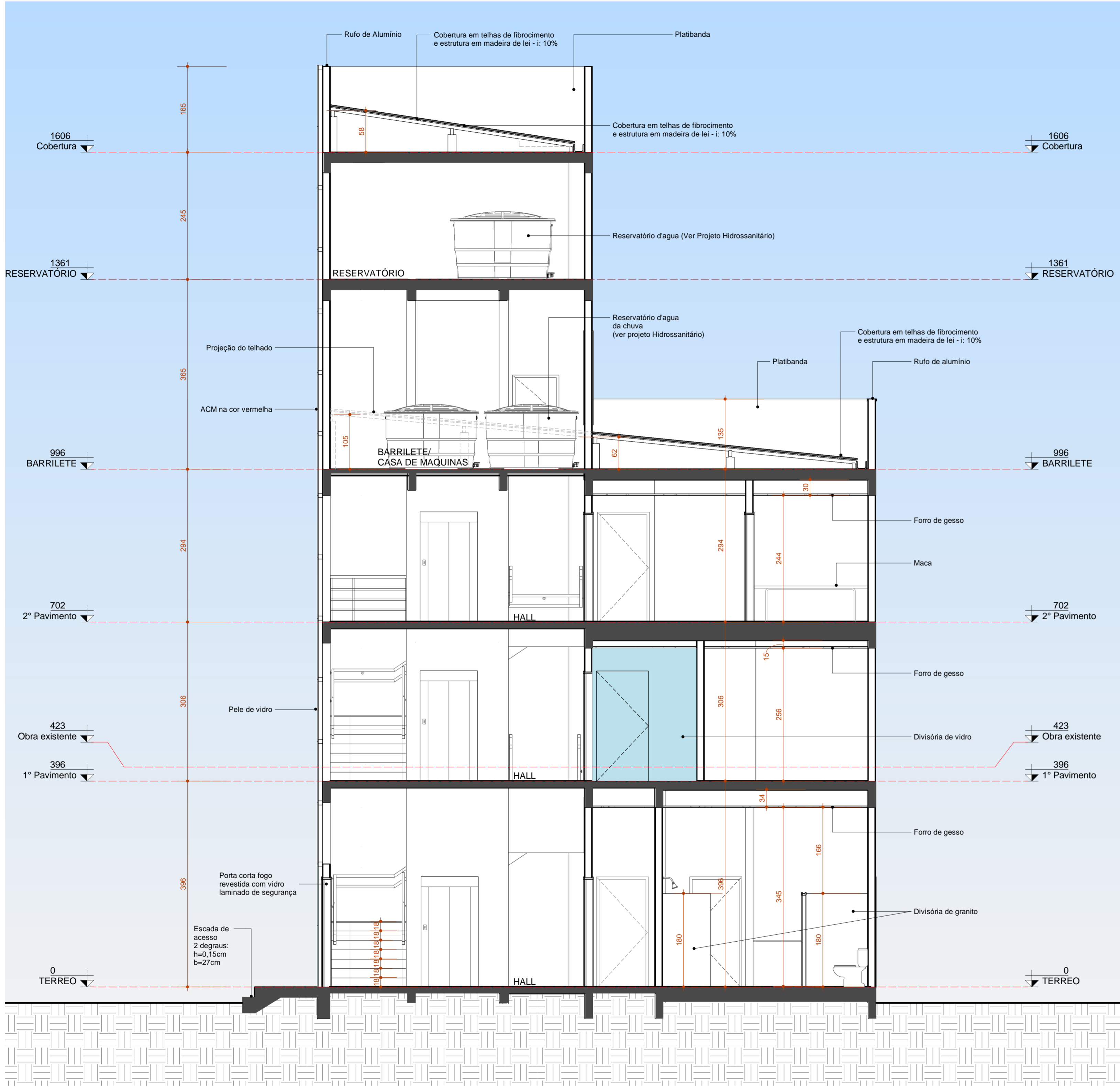
1 Corte BB'