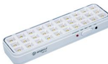
Luminária de emergência autônoma 30L.