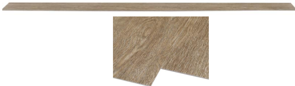
Piso Vinílico em placas

A conexão entre a manta aplicada sobre o contrapiso e a parede deve ser feita utilizando-se a peça: Arremate de rodapé e suporte curvo, especificada pelo fabricante do piso.