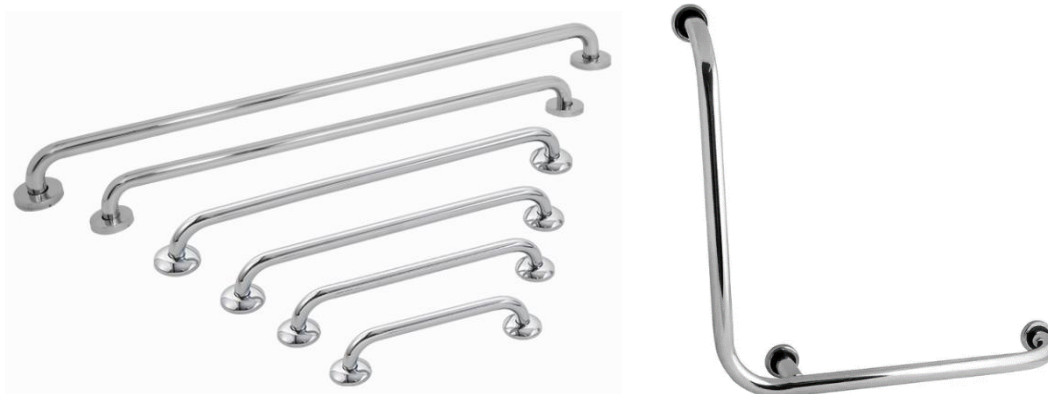
Exemplo de barras de apoio em aço inox

As barras de apoio devem ter as medidas de 40; 70 e 80cm conforme solicitação no projeto arquitetônico, e serem de aço inox com seção transversal (espessura), entre 30 mm e 45 mm.