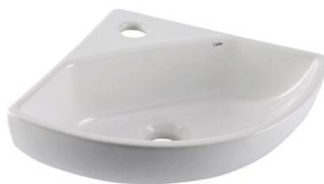
Cuba de canto

Onde estiver demonstrado em projeto deve ser instalado pia de coluna em louça branca conforme projeto arquitetônico.