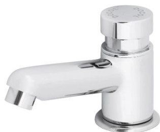
Torneira bica baixa Pressmatic

Para os sanitários que possuem pia ou cuba deve ser instalado torneira de mesa para lavatório, bica baixa, Pressmatic, com exceção do banheiro PCD.