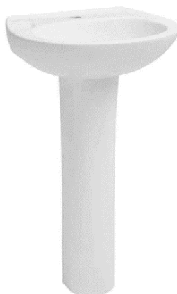
Modelo de pia de coluna em louça branca

Onde estiver demonstrado em projeto deve ser instalado pia de coluna em louça branca conforme projeto arquitetônico.