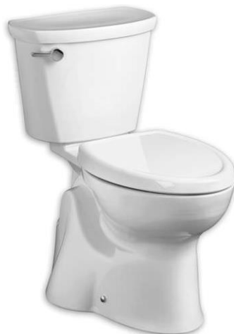
Vaso sanitário em louça branca com acionamento de descarga modelo alavanca na caixa acoplada.

No banheiro PCD o vaso sanitário de caixa acoplada deve ter acionamento por meio de alavanca, conforme a imagem abaixo: