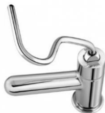
Torneira bica baixa Alavanca

Para o banheiro PCD deve ser instalado a torneira de mesa tipo Alavanca, conforme imagem abaixo.