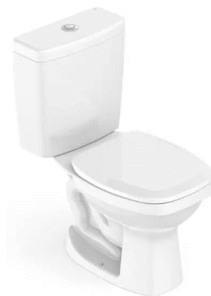
Modelo de vaso de caixa acoplada

As cubas de embutir devem ser ovais, na cor branca, com dimensões 36x36X14,5cm conforme imagem abaixo.