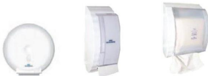
Dispensers de papel higiênico, sabonete e papel toalha

Os acessórios em plástico injetado (ABS) podem ser vistos na figura abaixo: