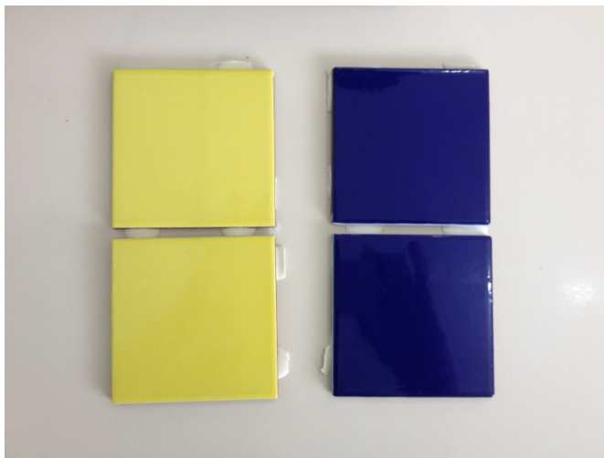
AZULEJO PADRÃO MÉDIO 25X40 cm

Será assentado revestimento de formato 10x10cm, na cores azul, amarela e branca, do piso acabado até uma altura de 1,20m nas circulações, no entrono do bloco novo bem como no espaço coberto.